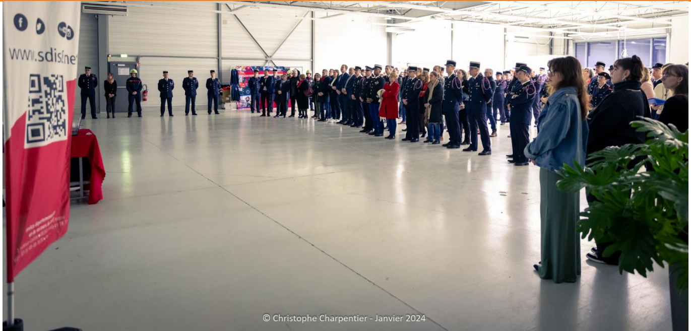
© Christophe Charpentier - Janvier 2024