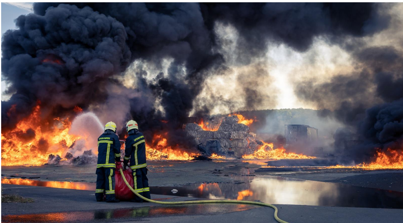
Intervention du 5 octobre 2023, feu de bâtiment industriel à Buxeuil - © Christophe CHARPENTIER | Service communication – SDIS 86.

POITIERS : intervention pour un accident de la circulation entre deux véhicules légers. Trois victimes, dont deux jeunes adultes - homme et femme d'environ 20 ans - ont été déclarés décédés. La troisième victime - un homme 22ans classé en UR, a été transportée au CHU Poitiers.