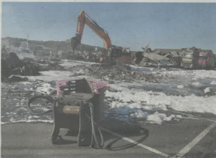
Opération déblayage et extinction des derniers foyers ce vendredi matin à TPMO à Buxeuil.

Les pompiers ont fini par éteindre le feu (mousse, eau et mouillant) mais les flammes ont tout détruit ou presque: le hangar métallique en charpente en bois (qui servait de bureaux, d'entretien des véhicules, de vestiaires...), les cartons (et autres matières plastiques) stockés dans la cour et au moins trois poids lourds (trois tracteurs et trois semi-remorques détachées) touchés par les flammes. Un employé a été brûlé au 2 e degré aux bras et à la jambe, précise-t-on sur place. Les entreprises voisines du transporteur Ouvrard sur la zone artisanale n'ont pas été touchées par l'incendie. La bonne nouvelle, c'est que l'activité de l'entreprise qui emploie six salariés ne sera pas impactée par le sinistre. C'est