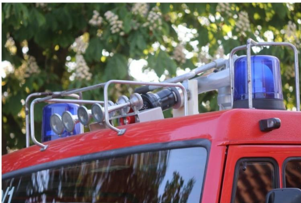
Grave incendie dans un pavillon de la Vienne

Publié il y a 5 jours le 08/10/2023 Par Anouck