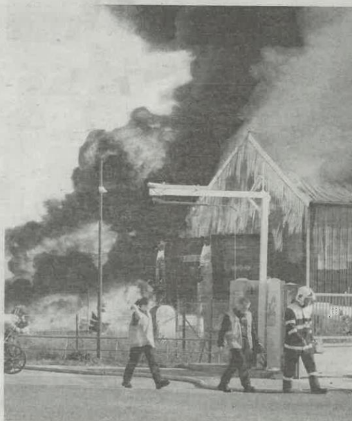
Incendie ce jeudi 5 octobre, à l'entreprise TPMO à Buxeuil.

Le feu serait parti du parking de l'entreprise où étaient stockés des cartons, du papier ou encore des matières plastiques,