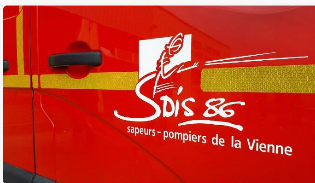
Deux jeunes sont décédés dans un accident de la route dans la soirée du 10 octobre 2023 dans la Vienne. (Photo d'illustration) © Radio France - Théo Boscher

Un terrible accident de la route a eu lieu dans la soirée du mardi 10 octobre 2023 sur la RD 910 sur la commune de Chasseneuil-du-Poitou (Vienne). Un choc frontal s'est produit au lieu-dit Grand-Pont vers 23 heures sur la route de Paris.