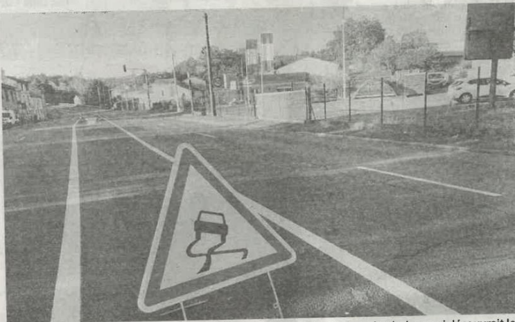
Les véhicules sont venus percuter le portail et le grillage d'un vendeur de piscines qui découvrait les dégâts ce matin.

En revanche, il n'y avait plus rien à faire pour les deux jeunes d'une vingtaine d'années qui se trouvaient dans la Clio noire. Lui résidait dans le secteur de La Villegieu-du-Clain, elle à Poitiers. La voiture roulait en direction de Poitiers quand le conducteur en a per-