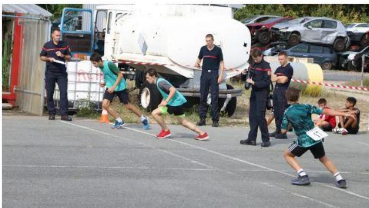
Les 89 candidats à la journée de recrutement de jeunes sapeurs-pompiers ont pris part à trois épreuves physiques, dont une course d'endurance.