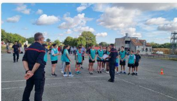
La journée départementale de recrutement des jeunes sapeurs-pompiers (JSP) s'est déroulée ce samedi 26 août, dans la Vienne.

La traditionnelle journée de recrutement des jeunes sapeurs-pompiers, c'était hier dans la Vienne. Ce samedi 26 août 2023, au centre de formation des sapeurs-pompiers à Valdivienne, 90 candidats entre 13 et 14 ans ont tenté le concours. À l'issue de plusieurs épreuves physiques, mais aussi des tests écrits et oraux , seuls les 24 meilleurs ont été retenus pour la formation des jeunes sapeurs-pompiers.