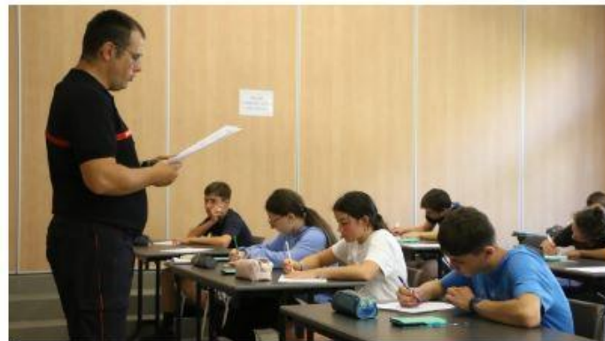
À plus d'une semaine de la rentrée scolaire, les candidats planchaient sur des épreuves écrites de français et de mathématiques.