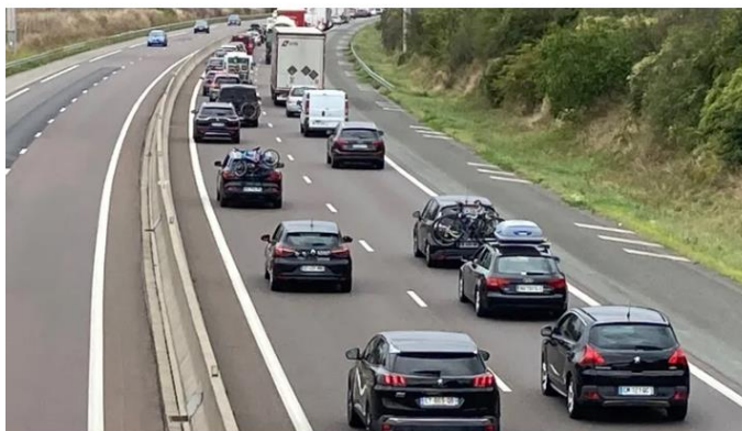
Malgré la fin de l'intervention des sapeurs-pompiers, le trafic reprend progressivement à la normale.

À la mi-journée, un accident est survenu sur l'autoroute A10, dans le sens Sud-Nord au niveau de Migné-Auxances. Impliquant six véhicules et 17 personnes, l'accident n'a fait qu'un blessé léger, mais la circulation a fortement été impactée.