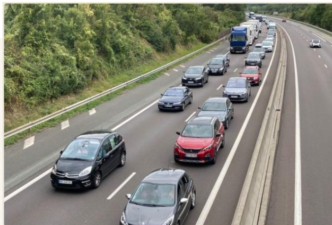
Suite à un accident sur l'autoroute A10, la circulation est fortement perturbée sur 17 km au niveau de Poitiers.

Après un accident dans le sens Sud-Nord, la circulation sur l'autoroute A10 est très perturbée sur 17 km, au niveau de Poitiers. Malgré six véhicules et 17 personnes impliqués, un seul blessé léger est à déplorer.