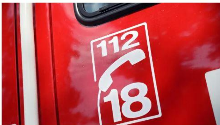
Neuf pompiers sont intervenus.

Jeudi 31 août 2023, vers 4 h du matin, sur la route départementale 347, à hauteur du carrefour à feux des Trois-Moutiers dans le Nord-Vienne, une collision frontale à faible allure a eu lieu entre un camion frigorifique et une voiture. Neuf sapeurs-pompiers ont été déployés. Au final, plus de peur que de mal : l'accident n'a fait aucun blessé, déclarent les pompiers et la gendarmerie.