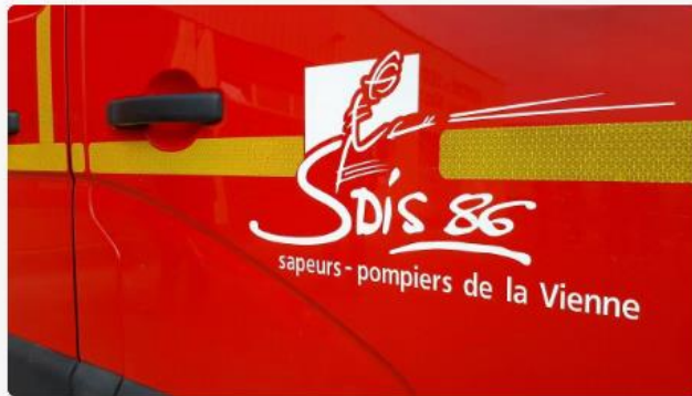
Sapeurs-pompiers Vienne SDIS 86 camion

Un homme est décédé dans un accident de la route, samedi soir vers Brux sur la nationale 10, vers 22h30. Il était assis à l'arrière d'un fourgon, conduit par un homme de 35 ans qui a perdu le contrôle de son véhicule. Celui-ci a franchit la barrière de sécurité à pleine vitesse avant de s'encastrer dans le pilonne d'un pont. Le passager est décédé sur le coup. Blessé légèrement, le conducteur est pris en charge au CHU de Poitiers. D'après les gendarmes, il a été testé positif aux stupéfiants, et sera placé en garde à vue à la sortie de l'hôpital.