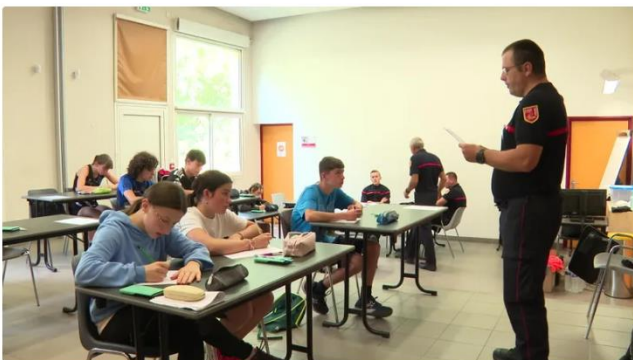
Les tests sportifs ne suffisent pas pour intégrer les jeunes sapeurs-pompiers. Les candidats doivent aussi se démarquer aux épreuves écrites et à l'oral de motivation.