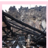
Au lieu-dit Salvvert, à Leignes-sur-Fontaine, il ne reste rien de l'habitation de l'octogonaire, comme au lieu-dit Coudret. Xavier Benoit

Deux feux distincts. Deux maisons entièrement détruites à quelques heures d'intervalle dans le même village. Un incroyable concours de circonstances a provoqué deux désolations, vendredi 24 février 2023, à Leignes-sur-Fontaine. La première alerte parvenue aux pompiers de la Vienne a concerné, vers 11 h, un départ de feu dans une habitation particulière du lieu-dit Le Coudret, entre Chauvigny et Leignes-sur-Fontaine.