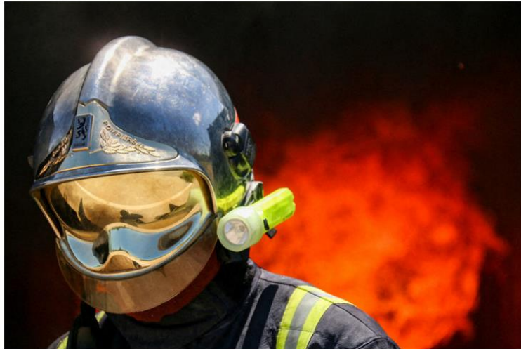
Les pompiers des Deux-Sèvres sont intervenus pour un feu de champ à proximité de Parthenay (Deux-Sèvres), ce mardi 6 septembre 2022.

Un feu de végétation s'est déclaré à proximité de la commune de Parthenay ce mardi 6 septembre 2022