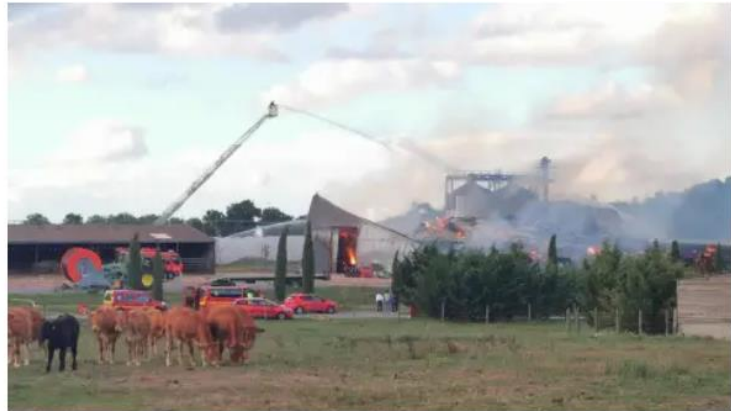
Un incendie s'est déclaré vers 16 h 45 ce jeudi 8 septembre 2022 à la Ferme de la Vergne, à Queaux.