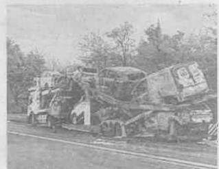
La remorque et les véhicules transportés ont flambé.

Un incendie spectaculaire s'est produit sur l'autoroute A10, mercredi matin vers 7 h, après la sortie Poitiers Nord en direction de Paris. Le chauffeur d'un semi-remorque transportant huit véhicules s'est garé sur la bande d'arrêt d'urgence après avoir remarqué une fumée suspecte. Le feu serait parti de l'essieu de la remorque ou d'un des véhicules électriques transportés. Seul le tracteur de l'ensemble routier a été épargné.