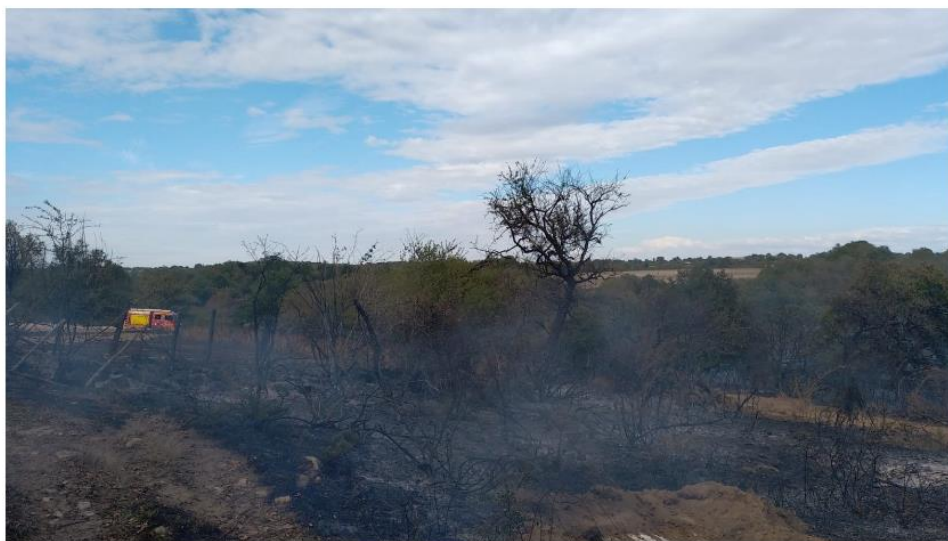
Trois hectares de champ sont partis en fumée mercredi dernier près de Parthenay.

Le 6 septembre dernier, les sapeurs-pompiers des Deux-Sèvres sont intervenus dans la commune de Gourgé au lieu-dit Le Moulin de Fresnes pour circonscrire un feu de végétation. Trois hectares sont partis en fumée.