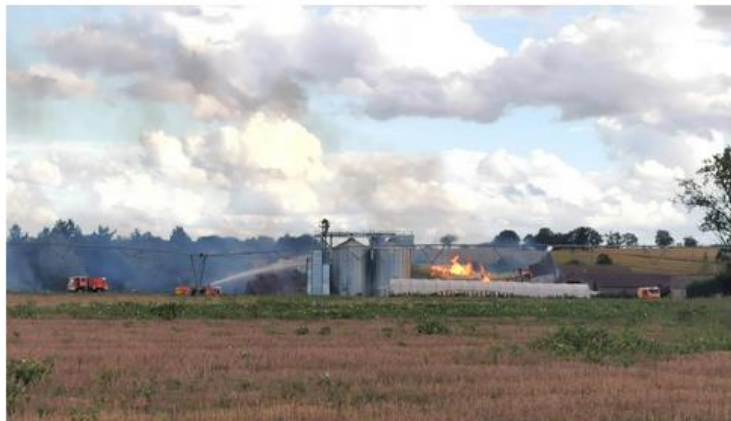
Les sapeurs-pompiers arrosent les silos pour les protéger des flammes.

Les sapeurs-pompiers sont également intervenus, à partir de 17h30, pour un feu sur la commune de Chaunay. Le bâtiment de 200 m 2 , à usage de menuiserie, a été éteint au moyen de deux lances. Quinze sapeurs-pompiers engagés.