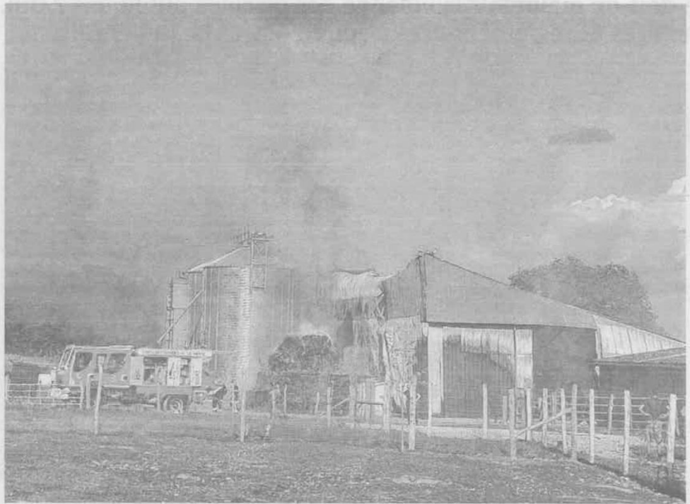
À Queaux, l'incendie d'un bâtiment agricole a nécessité l'intervention d'une cinquantaine de pompiers.

Un peu plus tard, une quinzaine de sapeurs-pompiers sont également intervenus, à partir de 17 h 30, pour un feu à Chaunay. Le bâtiment de 200 m 2 , à usage de menuiserie, a été éteint au moyen de deux lances.